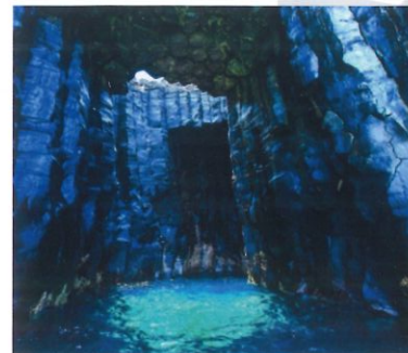
東吉嶼-西吉藍洞巡航-東嶼坪